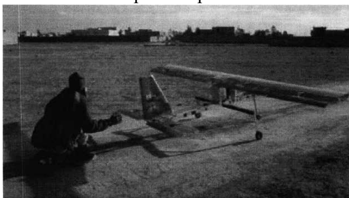
Рис. № 4 - малогабаритный летательный аппарат.

БВС-камикадзе является весьма специфичным классом беспилотной техники, информация о котором чаще всего носит секретный характер. Такой дрон представляет собой малогабаритный летательный аппарат (рис. № 4), способный нести несколько килограмм взрывчатки.