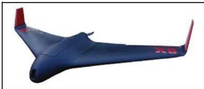
Рис. № 7 – БПЛА тип «летающее крыло».