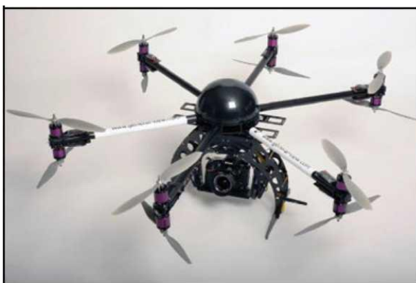
Рис. № 5 - многооторный БПЛА.

Тип БПЛА, который с каждым днем получают все большее распространение, - многооторные системы. Их еще называют мультикоптерами, квадрокоптерами, гексакоптерами, октакоптерами и тому подобное, в зависимости от количества несущих винтов. Характерная особенность - многооторная система, принцип полета - подобен вертолетному (рис. № 5).