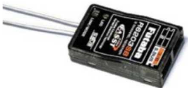
Рис. № 11 - Приемник аппаратуры управления.

Видеопередатчик (рис. № 10) - это устройство, передающее на наземную станцию изображение с камер БПЛА. Является самым заметным устройством на борту БПЛА, поэтому без необходимости включать его не стоит (это касается только тех БПЛА, которые хранят фотографии на борту), соблюдая режим радиомолчания. Такой режим уменьшает возможность применения противником средств РЭБ.