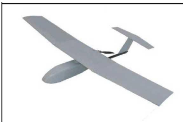
Рис. № 6 – БПЛА самолетного типа.

Существуют БПЛА, предназначенные для выполнения задач РЭР, РЭБ и связи. Скоростной диапазон работы - от 15 до 30 м/с. Рабочие высоты - в зависимости от оборудования и размеров аппарата, но всегда превышают 300 м. Обычно это диапазон высот 300 - 2000 м. Существует несколько аэродинамических схем самолетных БПЛА. Основные аэродинамические схемы – классическая (рис. № 6) и «летающее крыло» (рис. № 7).