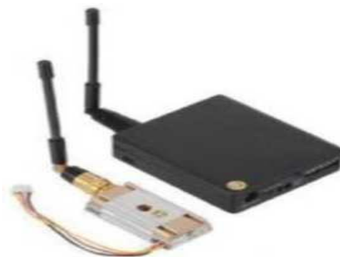
Рис. № 10 - Видеопередатчик.

Видеопередатчик (рис. № 10) - это устройство, передающее на наземную станцию изображение с камер БПЛА. Является самым заметным устройством на борту БПЛА, поэтому без необходимости включать его не стоит (это касается только тех БПЛА, которые хранят фотографии на борту), соблюдая режим радиомолчания. Такой режим уменьшает возможность применения противником средств РЭБ.