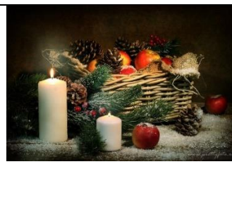
А) Новый год